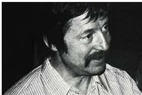
Wolf Biermann 1984